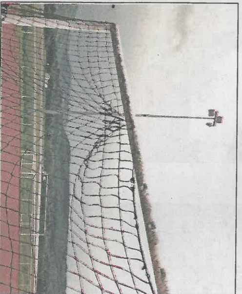
Thise responsabilise ses associations : 100 euros de moins en subventions pour le foot qui oublie (parfois)

26 ch. Bas des Vignes 25320 Boussières www.presta-decoupe-viande-boussieres.fr